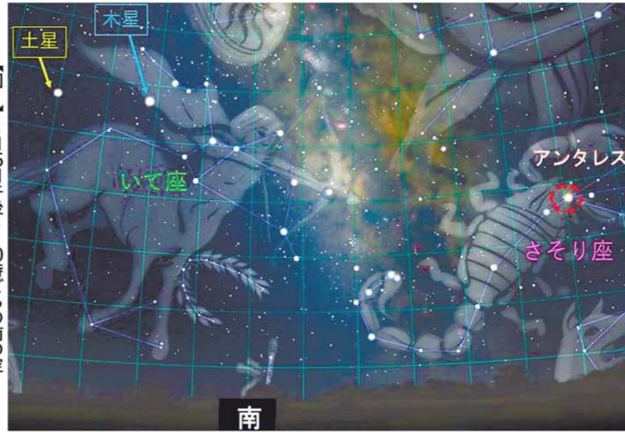
【図1】8月15日午後8〜10時ごろの南の空

「夏の星座の王様はどの星座だろう？」と星好きの仲間と議論になったことがありました。約半数が「さそり座」を挙げました。何となくとも形がきれいで、ちゃんとサソリの形をしているのがすごいんです。サソリの心臓に当たる赤い星「アンタレス」も迫力があ