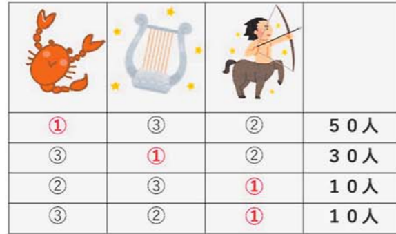
【図2】夏の星座の王様はどれ？